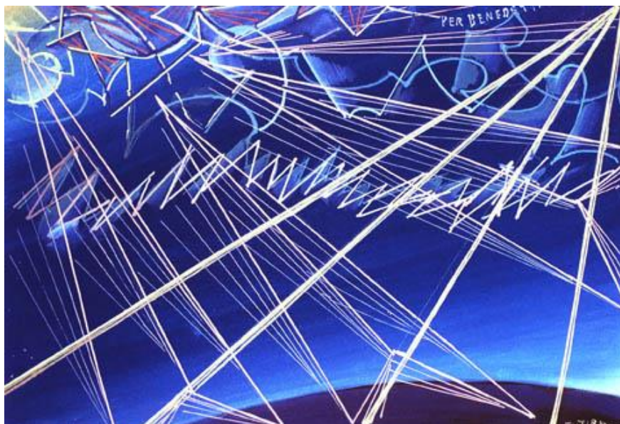
GIACOMO BALLA (1871-1958) TRASFORMAZIONE DI FORME 1918