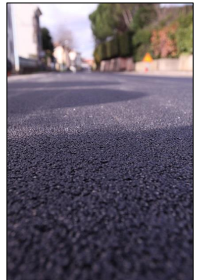
Figura 1 – Manto di usura a bassa emissione sonora con polverino di gomma

Gli interventi nell'ambito della tecnologia delle sovrastrutture stradali indirizzati al contenimento del rumore sono concentrati sulle caratteristiche superficiali della pavimentazione, che influenzano il meccanismo di generazione del rumore, e sulle sue caratteristiche di assorbimento acustico, che influenzano la propagazione sonora, il tutto in un processo di ottimizzazione che prenda in considerazione anche le esigenze prestazionali (caratteristiche meccaniche) e