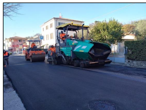
Figura 4 – Operazioni di stesa delle miscele con tecnologia "warm" in assenza di fumi. Sito I - Massarosa (LU)