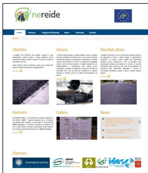
Figura 9 – Sito web del progetto LIFE NEREiDE

Grande attenzione è stata posta nelle attività di disseminazione indirizzate ai media , sia generalisti che tecnico-specializzati. Diversi articoli tecnici sono stati pubblicati su una delle principali testate specializzate dedicata alle infrastrutture viarie , mentre sono oltre 120 gli articoli pubblicati su testate cartacee e online .