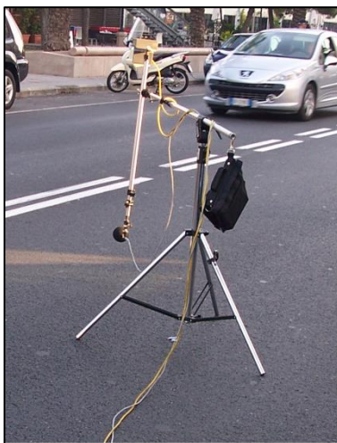
Figura 6 – Misura del rumore da rotolamento mediante metodo CPX