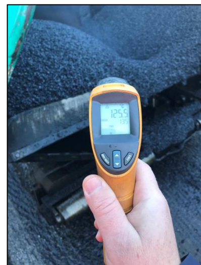
Figura 2 – Rilievo della temperatura di stesa delle miscele "warm". Sito I - Massarosa (LU)