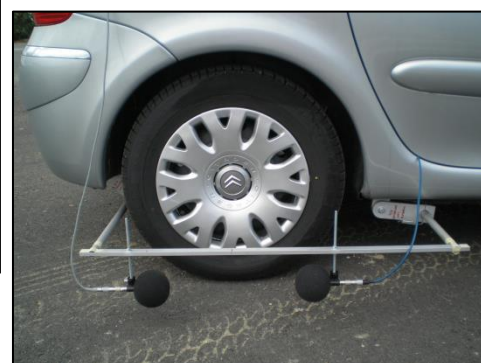
Figura 7 – Misura del coefficiente di assorbimento acustico in sito mediante metodo Adrienne

Lo scopo dei monitoraggi ante e post-operam è quello di poter quantificare, seguendo un approccio di tipo before-after, i benefici ottenuti con la realizzazione dei tratti di strada urbana sperimentali.