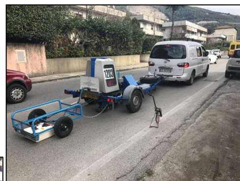
Figura 5 – Rilievo ante-operam delle caratteristiche strutturali delle pavimentazioni esistenti con apparecchiatura Falling Weight Deflectometer (FWD) e georadar. Sito I - Massarosa (LU)