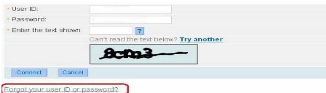
Figura 1: Pagina di accesso a REACH-IT

Il sistema REACH-IT genera una nuova password (valida per 5 giorni) e la invia automaticamente all'indirizzo e-mail indicato nell'account REACH-IT in questione. L'ECHA raccomanda vivamente agli "Organisation Manager" di verificare che l'indirizzo e-mail indicato nel proprio account sia corretto e, in caso contrario, di aggiornare i dati senza indugio!